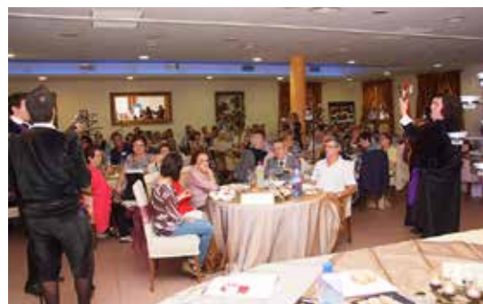
Homenatge a la gent gran, 2013