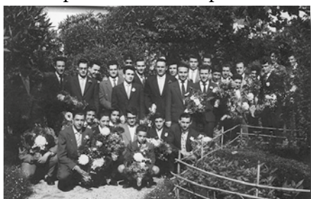
Nets i fillols dels avis en el primer Homenatge a la Vellesa, 1962

president de la Generalitat, M. Hble. Sr. Josep Tarradellas i Joan, que també havia estat nomenat president honorífic del Patronat a la Vellesa de Cervelló.