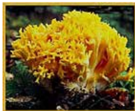
Peu de rata

Disponibles a boletairegironi.blogspot.com