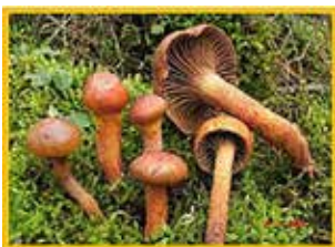
Cama de perdiu

Deixant de banda la història, però recuperant la bibliografia del doctor Cuello, us he de dir que a Catalunya hi ha milers de noms per esmentar els pocs centenars d'espècies de bolets que existeixen, i és molt curiosa la definició que se'ls ha donat amb el temps. Per exemple, si el nom del bolet parla d'una part de qualsevol animal, és un senyal de què és bo. Entre aquests hi tenim el peu de rata, la cama de perdiu o la llengua de bou. Per contra, si a la paraula bolet s'hi afegeix el nom de l'animal sencer, com passa amb el rovelló de cabra, aquest és dolent o no es troba entre els de més bona qualitat, conseqüència de què els pagesos de l'època entenien que se'ls havien de menjar les vaques, els bous o les cabres.