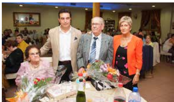
Homenatge a la gent gran, 2013

Per finalitzar aquest article sobre la festa homenatge a la gent gran de Cervelló denguany, vull manifestar en nom dels membres de la Comissió, que tots estan especialment contents de poder acompanyar als nostres avis en aquest dia tan entranyable per tots i més quan sents a una àvia, a l'entrada de l'Església que et manifesta que "ha estat un dia molt feliç per al meu marit i per a mi, i jo personalment he de dir que en aquesta celebració he sentit que em tractaven com a una reina".