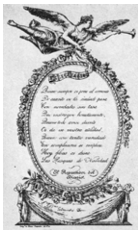
Targeta dels repartidors del Diari de Barcelona . 1831

Cada any per Nadal, Henry Cole, un conegut personatge del segle XIX que pertanyia a la societat londinenca, enviava unes notes als seus amics desitjant-los unes bones festes. Però l'any 1843, Henry Cole, no va tenir temps d'escriure aquestes notes, i li va dir a un amic artista, que es deia John C. Horsley, que li dibuixés una targeta per després passar-la a la impremta, i que cada any es pogués reciclar per Nadal perquè no posava l'any.