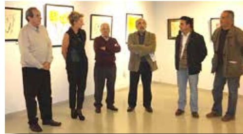
Moment dels parlaments.

Com és lògic, Hollywood no podia deixar passar aquest argument i s'ha dedicat, des que el cinema és cinema, a repetir aquest argument una vegada i una altra, però l'adaptació que mereix estar en aquesta llista tan extravagant és sense cap dubte la qual va realitzar Hulk Hogan , un exlluitador professional de lluita lliure, que aprofitant la seva popularitat va decidir fer el pas i apuntar-se al món del cinema. Va començar amb un petit paper a Rocky III , però això li va saber a poc i no va parar fins a aconseguir una pel·lícula on dóna curs a tot el seu talent.