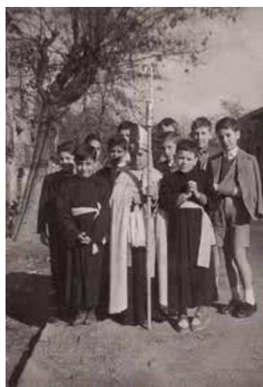
Festa de Sant Nicolau any 1958

Vi ranci, la confitura, pomes, peres i raiim, arrop i alguna altra fruita i alguns borregos fins. Tantes coses demanem doneu-nos el que vulgueu que el gloriós Sant Nicolau us ho pagui desitgem.