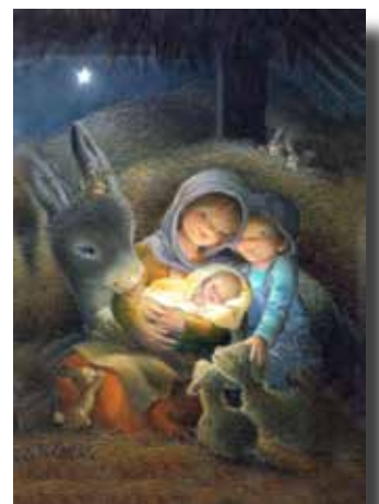
Targeta del dibuixant Ferrándiz

El dibuixant català Juan Ferrándiz Castells (1919-1997), artísticament conegut com Ferrándiz, va iniciar a l'any 1955 un tipus de nadala amb pastors o àngels riallers i bonhomiosos, que ha estat molt imitat, i fou reconegut internacionalment com a autor. Les seves nades van tenir molt d'èxit i la seva producció molt aviat va agafar fama internacional. Ferrándiz procedia del camp del dibuix animat, amb una predilecció del món de la infància, va crear un gènere poètic i infantil que va tenir un èxit immediat. Quasi a totes les llibreries de Barcelona, per no dir a totes, es veïen nades de Ferrándiz.