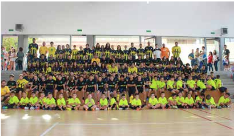
Presentació de tots els equips del CE Futsal Cervelló al pavelló municipal dia 28 de setembre de 2013.

Finalment, sense oblidar les activitats que actualment funcionen, es promouran de noves com el campus de tècnica tant a l'estiu, Setmana Santa com Nadal, el torneig mixt de Nadal, clínics formatius tant per a jugadors com per a entrenadors i es vol establir una col·laboració continuada amb la Federació Catalana de Futbol i que Cervelló sigui una seu de futbol sala dins de la comarca del Baix Llobregat.