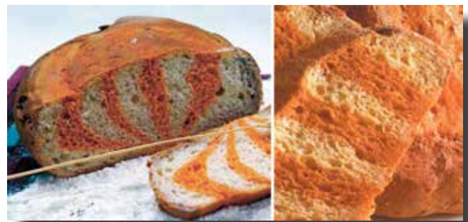
Pa de Sant Jordi

festa i perquè tots plegats poguéssim degustar un pa ben especial. Amb els anys s'ha consolidat com una tradició i especialitat imprescindible que es consumeix, només, durant dos dies, el 23 d'abril i l'11 de setembre. El Gremi ha treballat al llarg de tots aquests anys per acostar la recepta a la major part de fleques de Catalunya. I us he de dir que jo mateixa vaig poder tastar-lo, el passat 11 de setembre, gràcies a la seva elaboració per part de la Fleca el Llonguet. Us he de confessar que està boníssim!