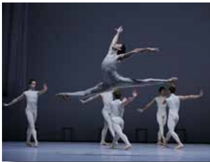
Semperoper Dresden Ballet

El Gran Teatre del Liceu no oferirà cap espectacle de dansa fins al febrer de 2014, dies 20 i 21, amb la presentació del Ballet de la Semperoper de Dresden en un programa íntegrament dedicat al coreògraf William Forsythe (preus entre 8 i 107 euros). Haurem d'esperar al mes de juliol, dies 23, 24, 25 i 26, dates en les quals actuarà el Ballet Nacional de España que presentarà el lloat muntatge inspirat en els quadres del gran pintor Joaquin Sorolla (preus entre 8 i 96 euros). Només sis funcions dedicades a la dansa en tota la temporada i quatre d'elles coincidint amb les vacances de molta gent són un balanç ben depriment pels afeccionats i una mostra més de la situació crítica en què es troba el teatre de les Rambles.