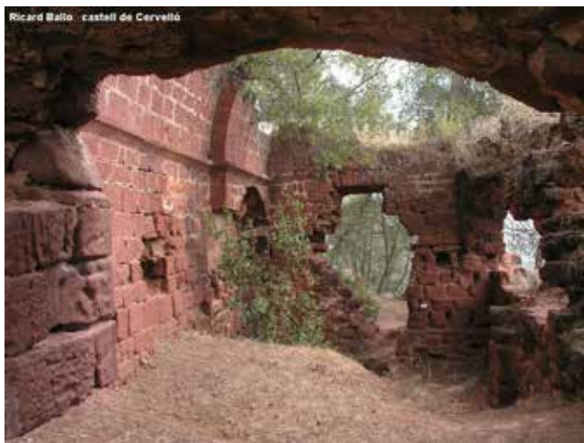
Castell de Cervelló

El riu Llobregat era un eix vertebrador del territori, però, alhora, l'obstacle principal per la comunicació humana. Els llocs per on es podia travessar eren punts cobejats. Principalment, només es podia creuar per dos llocs: per Martorell, a través del pont Romà construït en època d'August, anomenat popularment del Diable , que formava part de la Via Augusta, i per Sant Boi, a pas de barca, fins que al segle XIV s'hi va construir un pont.