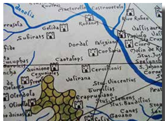
Litografia (parcial) A. Novell

D'altra banda, els Miquelets, grup d'homes voluntaris de Catalunya, que formaren regiment amb gent del país contra els borbònics, en aquest cas encapçalats per Miquel Sanjoan, havien sortit des de Barcelona el 30 de desembre de 1713, destinats a sorprendre la població de Martorell, i aconseguiren els dies 13 i 14 de gener de 1714 apoderar-se dels castells veïns: el de Cervelló, el de Castellví de Rosanes i el de Corbera.