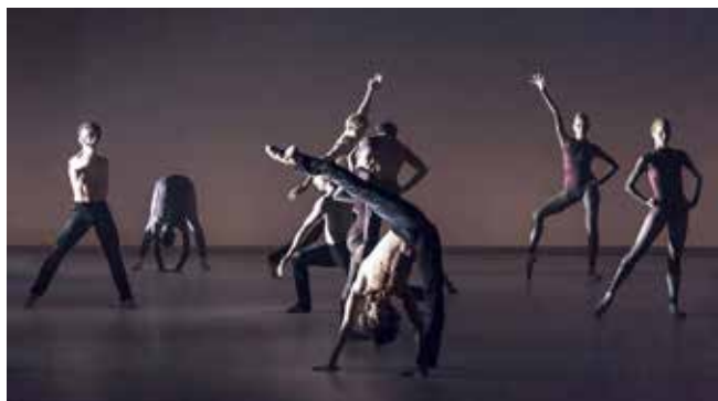
Ballet Victor Ullate

Afortunadament, hi ha algunes ciutats que, nedant a contracorrent, sí que han cregut en la dansa i programen en les seves temporades alguns espectacles de gran qualitat. Per tal que els afeccionats cervellonins en pugueu gaudir, em dispenso a detallar-vos alguns d'aquests actes per tal que els anoteu a la vostra agenda i així poder-ne gaudir.