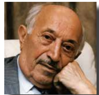
Sir Simon Wiesenthal

No deixa de ser curiós que ambdós totalitarismes empressin la persecució i el tancament indiscriminat de persones en camps de concentració com a mesura de terror generalitzat. Ambdós règims varen representar, doncs, idèntics graus de fanatisme i crueltat i, com deia en l'anterior