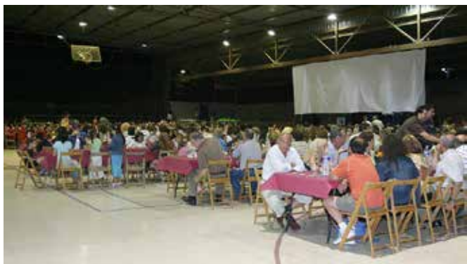
Imatge cedida per l'Ajuntament de Cervelló. 5a Festa de l'Esport, any 2005. Sopar, projecció i lliurament de premis.

La Festa de l'Esport es va convertir en un esdeveniment social i esportiu molt esperat al municipi, on cada juny s'esperava amb moltes ganes per part de totes les persones que participaven en les diferents activitats organitzades per les seves entitats. Una gran festa esportiva de final de temporada, on junts acomiadàvem la temporada omplint de gom a gom la pista poliesportiva.