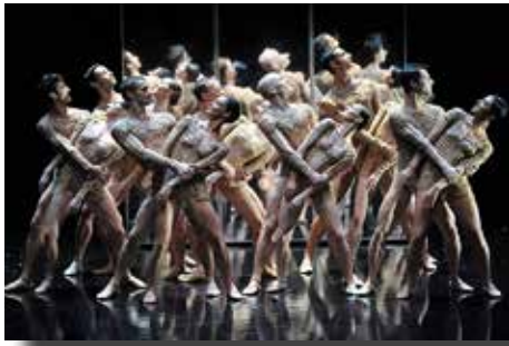
Malandain Ballet Biarritz

El Gran Teatre del Liceu no oferirà cap espectacle de dansa fins al febrer de 2014, dies 20 i 21, amb la presentació del Ballet de la Semperoper de Dresden en un programa íntegrament dedicat al coreògraf William Forsythe (preus entre 8 i 107 euros). Haurem d'esperar al mes de juliol, dies 23, 24, 25 i 26, dates en les quals actuarà el Ballet Nacional de España que presentarà el lloat muntatge inspirat en els quadres del gran pintor Joaquin Sorolla (preus entre 8 i 96 euros). Només sis funcions dedicades a la dansa en tota la temporada i quatre d'elles coincidint amb les vacances de molta gent són un balanç ben depriment pels afeccionats i una mostra més de la situació crítica en què es troba el teatre de les Rambles.