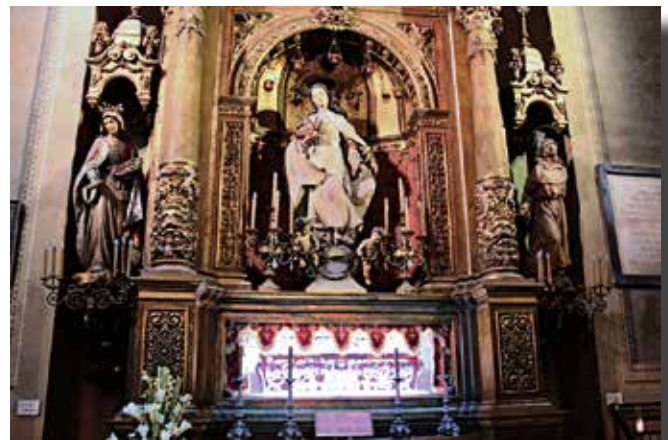
Altar i sarcòfag de Santa Maria de Cervelló

Segons la tradició, la Mare de Déu aparegué en somnis a Sant Pere Nolasc, Sant Ramon de Penyafort i al rei Jaume I, els exhortà a construir un orde monàstic dedicat a la redempció dels nombrosos captius cristians que queien en mans dels pirates nord-africans. Així s'inicia l'orde de la Mercè.