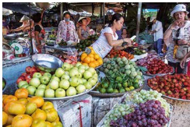
Parada de fruites.

El tren va avançar cap a l'esquerra i va recórrer una distància aproximada de dues estacions de metro de Barcelona. Es va aturar i s'obriren les portes, vàrem sortir del vagó i després de caminar endavant uns cinquanta metres, girant a la dreta, al fons hi havia gent. Havíem de caminar uns dos-cents metres, però a mesura que ens hi acostàvem, vàiem els rètols de control de passaports i vàrem respirar. Imagineu-vos les dimensions d'aquest aeroport que per passar el control de passaports s'hagi d'agafar un tren. El control va ser ràpid i sortíem al vestíbul sense problemes. Allà ens esperaria la persona que ens havia de dur a l'hotel.