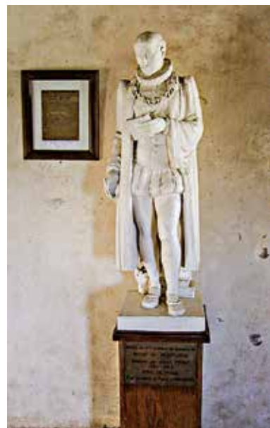
Michel de Montaigne.