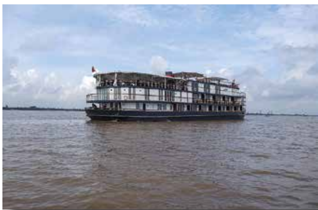
Vaixell que fa la travesia pel riu Mekong.

El passat 16 d'octubre vaig fer un creuer pel riu Mekong. Feia temps que tenia la intenció de visitar els temples d'Angkor, però no trobava l'agència que fes el viatge que a mi m'interessava. Enguany al catàleg de l'agència amb què normalment viatjo oferien tres dies en aquests temples, però s'hi havia d'accedir navegant pel riu Mekong des del Vietnam. Després de pensar-m'ho bastants dies, al final em vaig decidir i el 16 d'octubre a les dues del migdia em trobava a l'aeroport del Prat juntament amb dues persones més. Volàvem amb Emirates i l'avió sortia a les quatre de la tarda, podíem facturar l'equipatge directament a destinació, però que no sobrepassés els 30 kg.