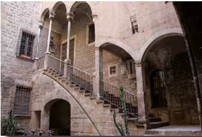
Palau dels Cervelló

El carrer més famós del barri de la Ribera, el de Montcada, va néixer al segle XII com a enllaç de les viles noves de Sant Pere i del Mar a la Barcelona medieval que creixia. Els primers establiments en el nou carrer sembla van ser els corresponents al "poble menut", és a dir, menestrals, petits obrers i, fins i tot, gent vinguda d'altres contrades peninsulars.