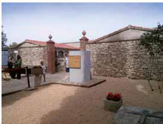
Monòlit commemoratiu al cementiri de Collbató