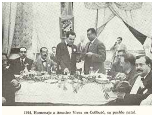
1914. Homenaje a Amadeu Vives en Collbató, su pueblo natal.

alguns fragments: "Amadeu Vives, uno de los principales músicos modernistas de Catalunya, autor de canciones tan enraizadas en la memoria nostálgica catalana como L'emigrant y La balanguera , está a punto de quedarse sin tumba. Sus herederos son incapaces de mantener el coste de la sepultura en el cementerio de Monjuic de Barcelona y el gobierno municipal de Collbató, su ciudad natal en el Baix Llobregat, no quiere hacerse cargo de los restos. [...] Amadeu Vives acabará en la fosa común de Monjuic si el Ayuntamiento de Collbató no modifica su postura".