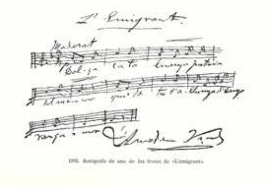
1891. Anticipo de una de las obras de «L'emigrant».