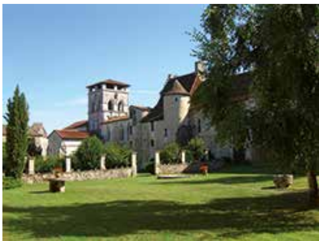
Chateau de Montaigne.