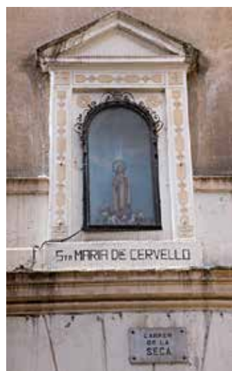
Fornícula amb una imatge de Santa Maria de Cervelló

Monedes d'or, d'argent i de coure es fonaren fins al seu tancament l'any 1879. Actualment encara hi ha qui se sorprèn en passar pel carrer de la Seca i veu una alta xemeneia del segle XIX sobresortint de la teulada (de les poques que encara queden fetes amb teules) d'aquesta antiga indústria.