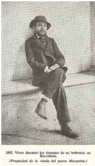
1892. Vives durante los campos de su bohemia en Barcelona. (Propiedad de la viuda del poeta Marquina.)

El passat 20 de setembre, les despulles del mestre Amadeu Vives varen retornar al seu poble natal de Collbató. Fou un acte senzill però molt emotiu i significava el reconeixement per part dels seus convilatans d'un dels músics catalans més universals.