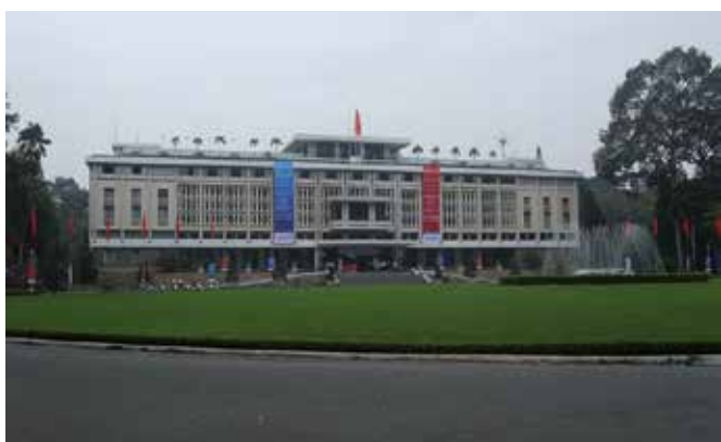
Palau de la Reunificació

Quan l'avió va començar a perdre alçada per aterrar a l'aeroport d'Ho Chi Minh (l'antiga Saigon) va aparèixer una nota a la pantalleta del seient del davant que informava del número de cinta per on podríem recollir el nostre equipatge. L'aeroport de Saigon, si el comparem amb el de Dubai, era de dimensions reduïdes i fàcilment vàrem trobar les oficines de la policia per sol·licitar el visat d'entrada al país. El que no fou tan fàcil fou aconseguir-lo. En una finestreta ens donaren un imprès que havíem d'omplir amb les nostres dades, en una altra finestreta havies de pagar 45 dòlars per persona, que era el preu del visat d'entrada vàlid per un mes. Un cop emplenat l'imprès juntament amb dues fotografies i el passaport s'havia d'entregar en una altra finestreta i finalment en una altra finestreta et donaven el passaport juntament amb el visat grapat en una pàgina. Tot fou molt fàcil, però vàrem haver-nos d'esperar dues hores perquè ens donessin el passaport i això que érem dels primers!