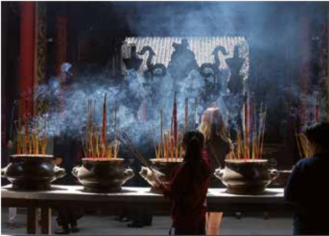
Interior d'una pagoda al barri de Cholon

arribar a la Xina i aquell racó del temple explicava la seva arribada al país xinès.