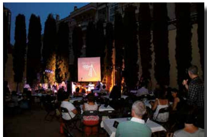
Jardins de Can Comamala

“La paraula poètica vol oferir-se com a eina transgressora, com a recurs natural per tal de foradar la xarxa, per transcendir el límit d'allò conegut (anomenat) i proposar i plantejar noves o diferents visions o interpretacions de la realitat, esperonant-la perquè s'expandeixi en altres direccions, generant altres situacions, creant-ne i recreant-ne amb multitud de matisos no contemplats fins al moment.”