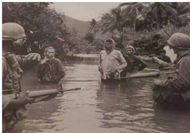
Fotografia exposada al Museu de la Guerra

lloc actualment hi ha l'anomenat Palau de la reunificació, que és un orgull del poble, ja que va ser el primer edifici públic construït per un arquitecte vietnamita. Vàrem veure la catedral de Notre Dame, una església catòlica com la de París de dimensions més reduïdes, construïda al segle XIX i tota feta de maons. Al Vietnam hi ha aproximadament uns 9 milions de cristians, el 90% dels quals són catòlics. El Teatre de l'Òpera, construït pels francesos a l'època colonial imitant els teatres d'òpera europeus i on actualment es fan actuacions de circ i de màgia. L'òpera no agrada als vietnamites. El Museu de la Guerra, que podria anomenar-se dels crims de guerra i de les atrocitats comeses tant pels americans com pels xinesos o francesos, remarcant els efectes de les bombes de napalm sobre la població, una primera planta horrible on es mostren amb fotografies de color totes les conseqüències d'aquestes bombes. Fou horrorós. Vaig sortir ràpidament i esgarriat d'aquesta planta. La segona planta destinada a material bèl·lic amb un apartat de pòsters i portades dels diaris de l'època amb manifestacions de tot el món en contra de la guerra. Com podeu suposar no n'hi havia cap de l'Estat espanyol. La tercera planta estava dedicada als Estats Units amb una col·lecció de fotografies fetes pels millors fotoperiodistes de l'època. El recull fotogràfic era veritablement impressionant.