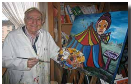
"Kéry" al seu estudi

L'artista s'ha volgut retratar amb la seva pintura La derrière tourner , obra al·legòrica de la mort, en què un grup de persones entren dins d'una carpa de circ, (en la fotografia tapades per la paleta del pintor), que després es transformen en globus i que s'alcen cap el cel.