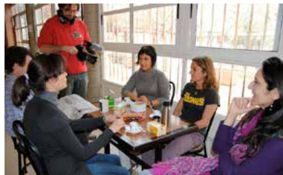
Reunió amb els mestres

No vull que se'm mal interpreti, sobre totes les professions, la de mestre és la que més respecto, perquè és una professió plena de sacrificis no reconeguts, però també és la que més corre perill d'estancament, ja que els coneixements a impartir rarament canvien de curs a curs, els mètodes per a fer-ho tampoc és que canviïn sovint. I es crea una desvinculació evident entre mestre i alumne. És fa necessari un procés d'aprenentatge dels docents. I és aquí on el cinema és fa una eina valuosíssima.