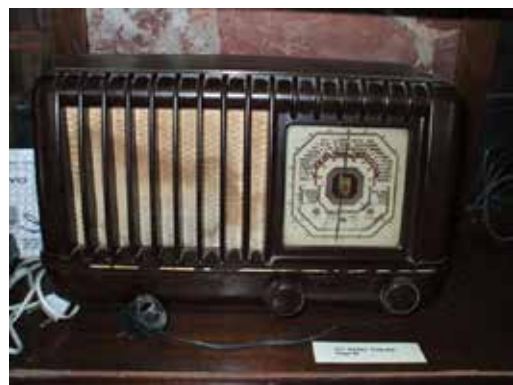
De l'exposició “ Fa quatre dies... ”