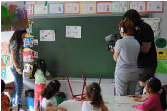
Rodant la pel·lícula Foto, Christian Feijóo

En resum, es tracta de viure en la nostra època i de potenciar el cinema com a eina comunicativa i pedagògica complementària a l'ensenyança tradicional. En definitiva, una forma original per tal que ni els mestres ni els alumnes s'avorreixin.