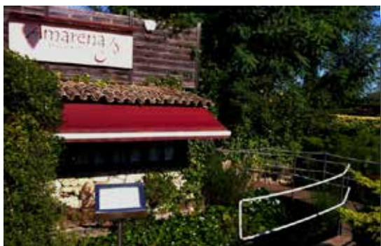
Jardins d'accés al restaurant