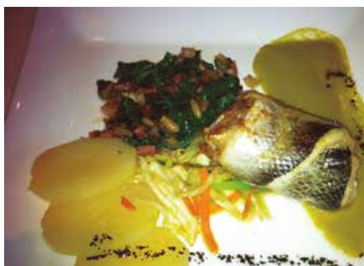
Llobarro amb espinacs frescos

Podeu degustar la cuina de l'Amarena mitjançant un menú o a la carta amb preus que oscil·len entre els 35-45 euros per persona. El menú és més econòmic. Cal que feu reserva prèvia. El restaurant té un espai a Facebook i contacta amb els seus clients mitjançant el correu electrònic, enviant-los les novetats de la seva carta de temporada. Us recomano de bon grat que us hi acosteu per gaudir de la bona cuina internacional, combinada amb la millor cuina catalana!