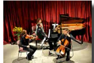
Trio Arriaga

La gran qualitat del trio va quedar palesa durant tot el concert: conjunció perfecta, absolut domini de l'instrument i gran força interpretativa. El públic va certificar la seva actuació amb aplaudiments unànimement entusiastes.