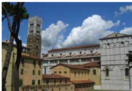
Lucca