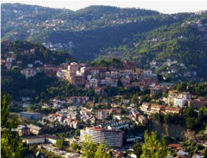
Corbera, vista general

Us agradarà visitar el restaurant Casa nostra, on gaudireu d'un ambient relaxat a la vegada que podeu degustar un bon menjar adaptat a les especialitats de cada estació de l'any. A l'estiu podeu gaudir a la terrassa de música de jazz en directe en un ambient ideal per compartir amb parella, amics o família, i a la nit de les llàgrimes de Sant Llorenç, observar la pluja d'estels.