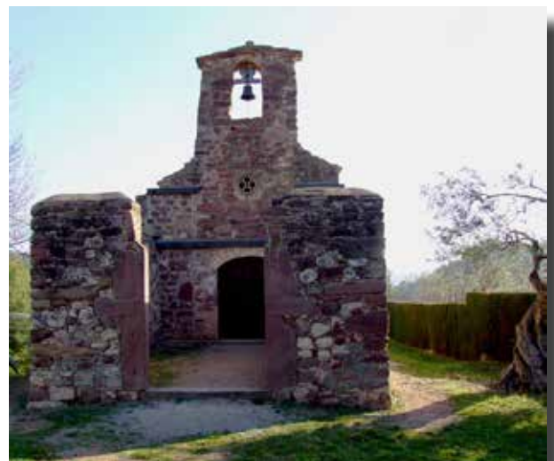
Capella de sant Cristòfol

La representació es fa en un marc natural incomparable, com és la muntanya de "la Penya del Corb" coneguda com "l'avançada", i són més de 200 persones - famílies de Corbera - les que actuen desinteressadament en les fredes nits de l'hivern, amb la il·lusió de fer arribar a tots els visitants aquest emocionant testimoni de Nadal.