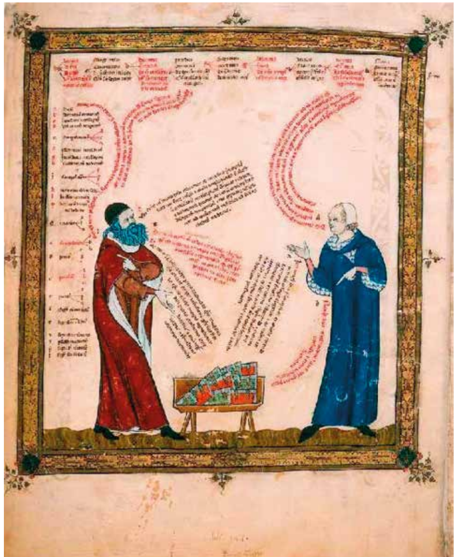
Il·lustració de l' Electorium parvum seu breviculum .

És el primer autor medieval que empra una llengua romànica per parlar de matèries com la filosofia o la teologia, que fins aleshores només s'havien tractat en llatí. És el creador de la sintaxi moderna catalana i d'un model de llengua culta i unificat, comparable al que representa Dant per a l'italià,