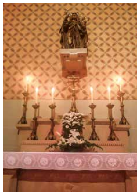
Altar dedicat a Santa Maria de Cervelló a l'església parroquial de Sant Esteve

El propassat 13 de febrer, vàrem celebrar el 325è aniversari de la canonització de Santa Maria de Cervelló. L'any 1692 el Papa Innocenci XII canonitzà la Santa que dona el nom a l'església vella del nostre poble. Segle Nou, com a prova de la devoció a la seva patrona i mostra del compromís renovat amb la restauració i manteniment de l'església de Santa Maria, va fer una ofrena de flors a l'altar que a l'església parroquial de Sant Esteve hi té dedicat la Santa.