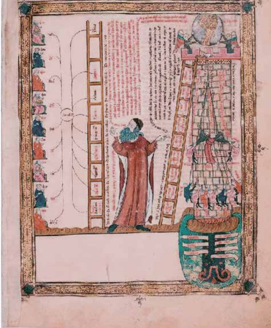
Pàgina del manuscrit lul·lià Ars magna generalis ultima de la ciutat de Karlsruhe , on apareix fent doctrina Ramon Llull.

Cervantes per a l'espanyol o Goethe per a l'alemany. A més, el seu català és elegant i articulat, amb un lèxic ampli per a un moment en què encara no hi ha tradició literària. D'altra banda, podem dir també que no dista gaire del català actual i que els textos es poden llegir sense gaire dificultat.