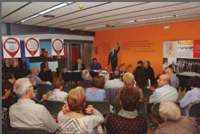
Taula rodona sobre la figura del president Tarradellas