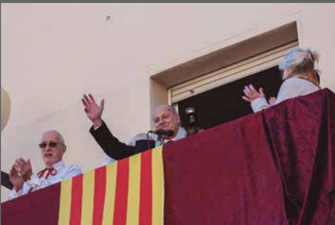
Representació de l'arribada de Tarradellas a Cervelló