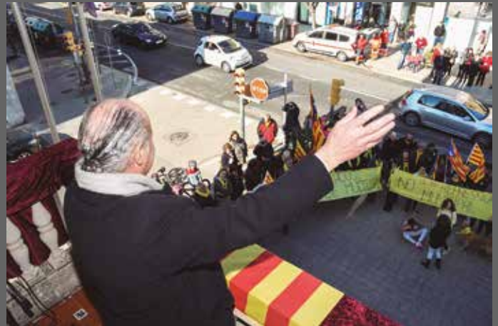
Representació de l'arribada de Tarradellas a Cervelló