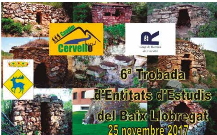
Video Gaudim Cervelló.

Ja fa temps que gent del grup Gaudim Cervelló, sortim a caminar pels paratges del nostre entorn.