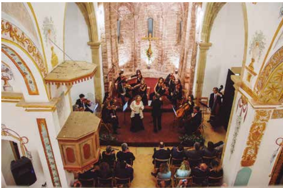
L'Orquestra de Cambra Catalana en el concert cloenda de l'Any Tarradellas.

Un cop acabat el concert, es va procedir a inaugurar l'esperat enllumenat exterior de l'església de Santa Maria, concloent així l'últim acte de l'Any Tarradellas a Cervelló