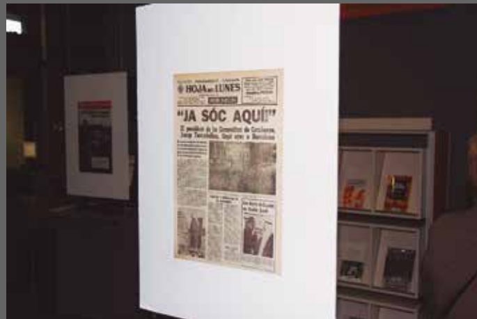
Portada de La Hoja del Lunes, amb la notícia de l'arribada del president