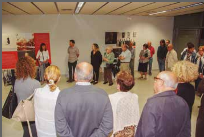
Inauguració de la Sala Tarradellas a l'Ateneu