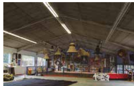
Taller dels Castells.