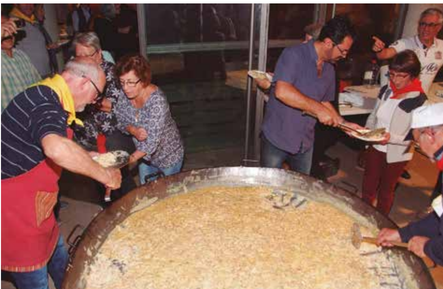
Cuinant l'omelette gegant.

L'esforç de les nostres entitats i els sinergies entre elles ho van fer possible.