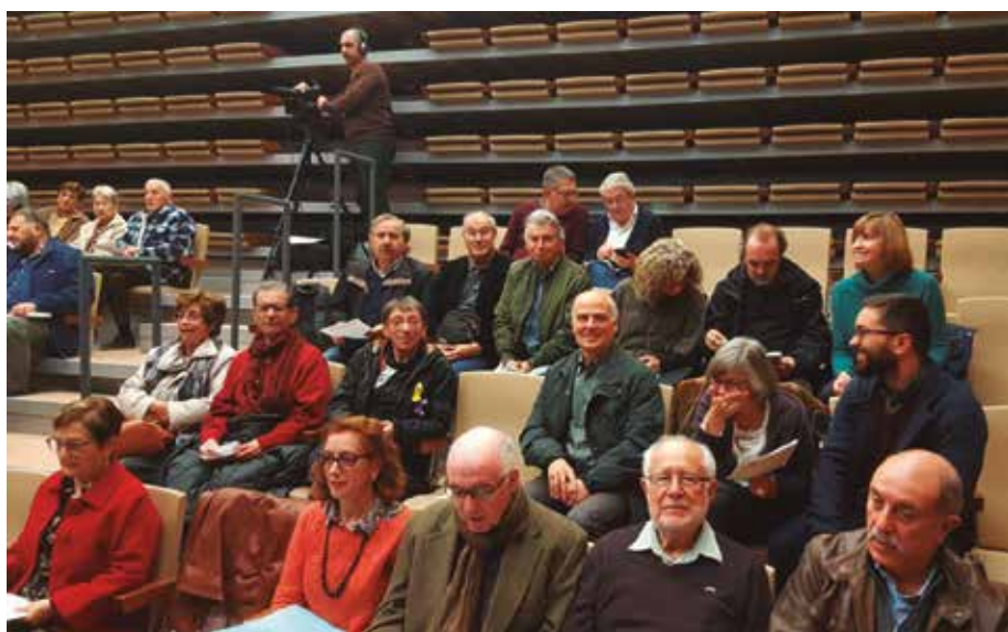
Membres del Grup de Recerca i Gaudim Cervelló.

A continuació ens vam desplaçar a la casa-museu Ca la Cinta, casa de pagès del segle XIX, on hi vam fer una visita molt recomanable al Museu del Cinema Amateur i del Joguet.