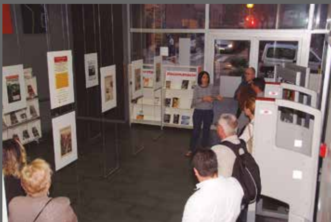
Inauguració de l'exposició de portades de diaris de l'època