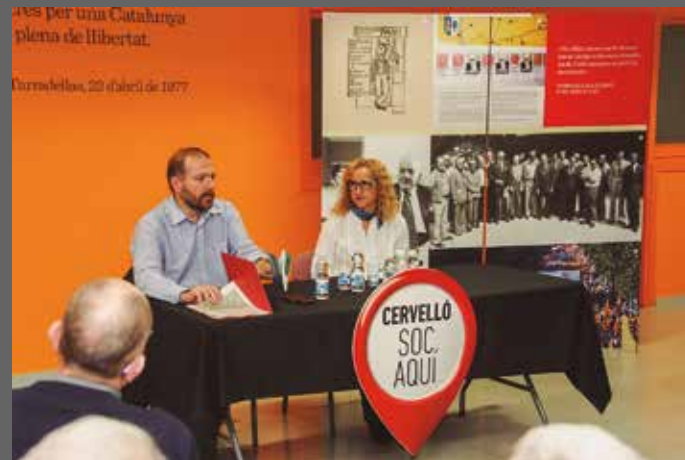
Taula rodona i col·loqui sobre el llibre "Carta en defensa pròpia"