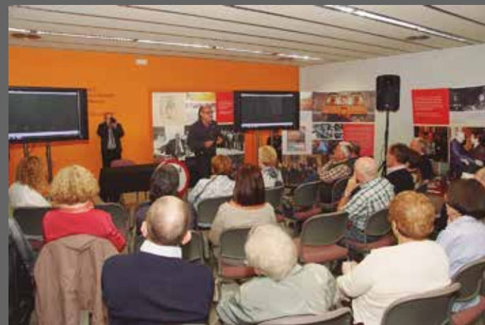
Cineforum i col·loqui sobre la pel·lícula "Del Pintallabis a la bala"