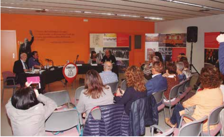
Una de les taules rodones que es van celebrar.

tiva, les dramatitzacions d'altíssima qualitat i els recursos visuals impactants. La cloenda, el 23 d'octubre a l'església de Santa Maria va ser d'aquelles que no oblidarem, amb el concert de l'Orquestra de Cambra Catalana, que va compartir amb la presència del conseller Jordi Turull, altres polítics, i representants de les diverses entitats de Cervelló, va estar a l'alçada de la circumstància i va despertar l'interès de nombrosos mitjans de comunicació de Catalunya, d'Espanya i fins i tot de Finlàndia. Aquell dia el nostre poble es va veure molt i molt gran.