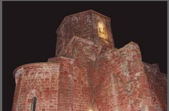
Inauguració de l'enllumenat exterior de Santa Maria