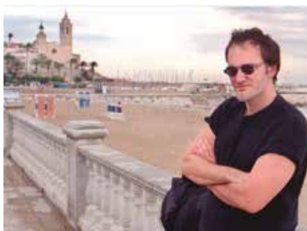
Quentin Tarantino, a Sitges.

Com a festival, Sitges ha estat motor per l'audiovisual català i segur que ha tingut molt a veure per a que ara tinguem directors d'èxit mundial com en J. A. Bayona, Jaume Balagueró, Jaume Collet-Serra, etc.