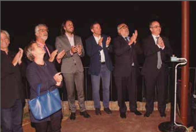
Inauguració de l'enllumenat exterior de Santa Maria