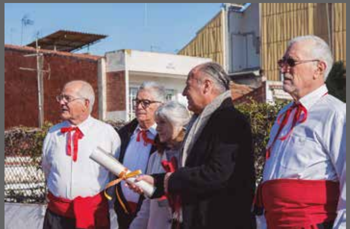
La Coral Diana, nomena a Tarradellas "Cantaire d'honor"