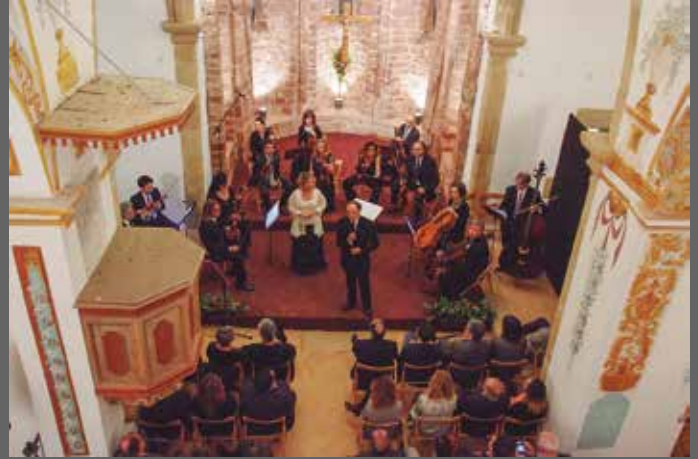
Concert de cloenda de l'Any Tarradellas a Santa Maria, ofert per la OCC