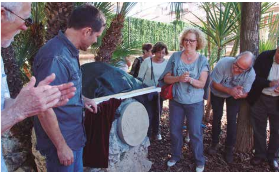
Inauguració d'una placa commemorativa dels 28 anys d'Agermanament amb Saint Martin le Beau, als jardins que Cervelló hi té dedicats a aquesta vila agermanada.