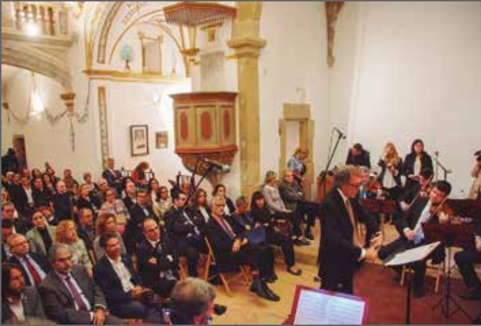
Concert de cloenda de l'Any Tarradellas a Santa Maria, ofert per la OCC