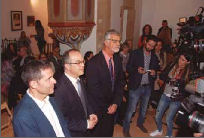
Inauguració de l'enllumenat exterior de Santa Maria