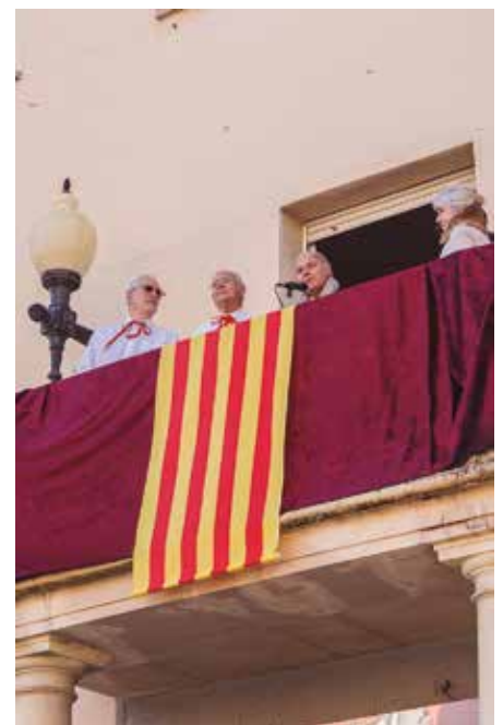
Rememorant al president Tarradellas, ara fa 40 anys, des del balcó de l'Ajuntament de Cervelló.

El 15 de gener passat també va celebrar els 40 anys del retorn del president al seu poble, va ser una celebració molt més lúdica i popular on vam reviuir l'arribada de Josep Tarradellas i Antònia Macià al poble amb el mateix cotxe que ho van fer fa 40 anys, però amb dos personatges que van intentar recordar l'aspecte i l'actitud dels il·lustres visitants.