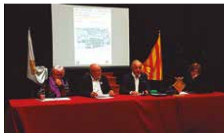
Inauguració de la Trobada.