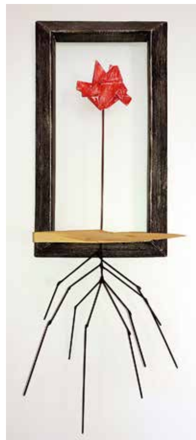
"Hacmoriana flor". 2016 Fusta, ferro, esmalt i acrílic 65 x 30 x 14 cm