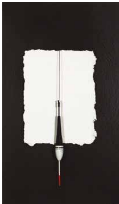
"Eyeku". 2017 Tela sobre bastidor, esmalt, paper, boia i fil 35 x 27 x 5 cm