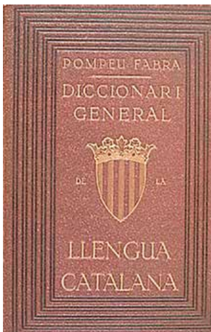
Diccionari general de la llengua catalana. 1 o edició 1932

El 1911 funda la Secció Filològica de l'Institut d'Estudis Catalans, que presidí des del 1917 i fins al 1948. També va presidir el mateix Institut d'Estudis Catalans entre el 1921 i el 1935.