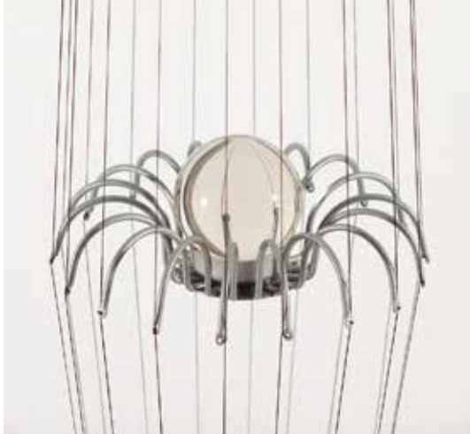
"Futur". 2016 Escultura de sostre Ferro, fusta, fil, plom i vidre 215 x 30 x 50 cm