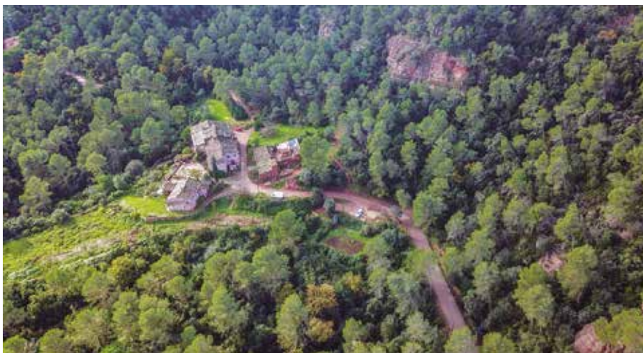
Can Sala de Baix

la Plana de Ca n'Esteve, on baixarem passant pel camp de futbol fins a la riera de Cervelló. La creuem i tornem pel parc de la Timba fins a arribar al punt d'inici.