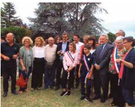
Viatge a St. Martin, 2017

S i una cosa defineix Cervelló, és la seva activitat associativa. Tenim entitats de tota mena, les esportives, les lúdiques, les culturals... de futbol i futbol sala, de bàsquet, de rugbi, d'hípica, de ball, de puntaires, de teatre, de música, de gegants, d'art, de conservació del patrimoni, de noves tecnologies... i així fins a 43 associacions amb un munt de persones implicades. Sembla que a Cervelló ens falta temps per apuntar-nos a mostrar les nostres aficions i inquietuds, lluitar per elles, compartir-les i fer d'aquest un poble més solidari i actiu, perquè el teixit associatiu viu més enllà del temps i del color dels consistoris, el teixit associatiu és un dels millors indicadors de la salut i la