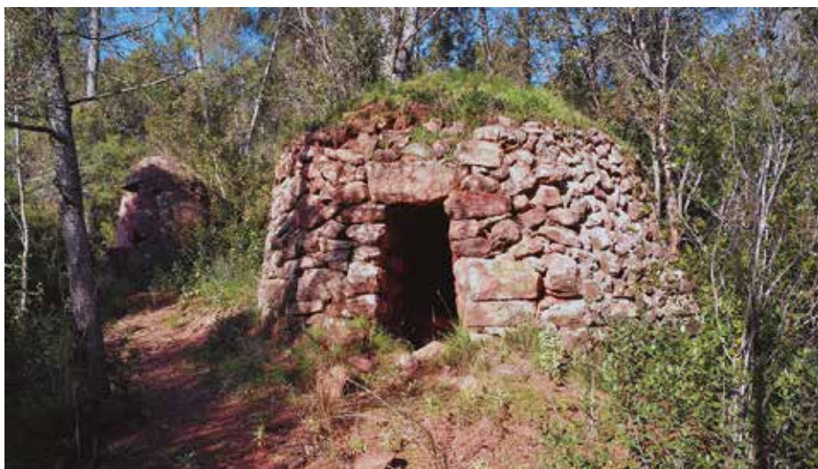
Barraca de vinya i pou.