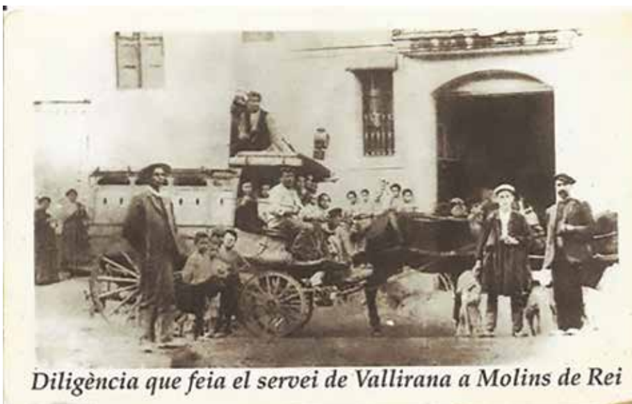
Diligència que feia el servei de Vallirana a Molins de Rei

Amb l'arribada de l'automòbil, que s'inicià a principi del segle XX, sorgeix un problema a les carreteres, que era l'excés de velocitat d'aquests vehicles.