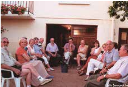
Reunió de bons amics

S i una cosa defineix Cervelló, és la seva activitat associativa. Tenim entitats de tota mena, les esportives, les lúdiques, les culturals... de futbol i futbol sala, de bàsquet, de rugbi, d'hípica, de ball, de puntaires, de teatre, de música, de gegants, d'art, de conservació del patrimoni, de noves tecnologies... i així fins a 43 associacions amb un munt de persones implicades. Sembla que a Cervelló ens falta temps per apuntar-nos a mostrar les nostres aficions i inquietuds, lluitar per elles, compartir-les i fer d'aquest un poble més solidari i actiu, perquè el teixit associatiu viu més enllà del temps i del color dels consistoris, el teixit associatiu és un dels millors indicadors de la salut i la