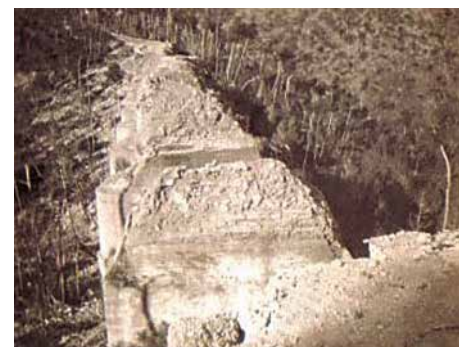
El pont del Lladoner després de la Guerra Civil.

i 1931. Es crearen quatre seccions de carreteres: la nord-est, la nord-oest, la sud-est i la sud-oest i dues variants d'itineraris: els radials i els transversals. L'itinerari que passava per Cervelló corresponia a la secció nord-est, i era un dels transversals. La seva identificació constava amb la numeració XII-XIII, això és València, Castelló, Tarragona i Barcelona amb una longitud de 377 quilòmetres. Segons la memòria de l'esmentat circuit de 1926, consta que la longitud de Cervelló és de 2,40 quilòmetres i la classe de paviment que es col·locà era macadam ordinari i formigó mosaic, com tot el tram entre Molins de Rei i Avinyonet. A Vilafranca del Penedès col·locaren llambordes. L'any 1930, entre els quilòmetres 354 i 358, on estava inclòs el nucli urbà de Cervelló, es van presupostar obres de conservació consistents en "acopios y su empleo", que estaven adjudicades a Juan Albós, les quals havien d'estar acabades el gener de 1931, amb un import d'adjudicació de 145.180 pessetes. Un enginyer que dirigia la