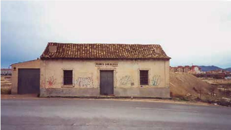
Casella típica de peó caminer.

Article Francisco Catalina, el último peón caminero .