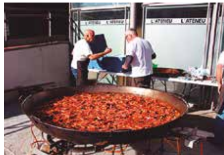
A Cervelló, la Fideuà. Desembre 2015

D'aquestes associacions, aquest any celebra el seu 30è aniversari l'Agermanament Cervelló - Saint Martin Le Beau, una entitat que manté units dos pobles, l'un a Catalunya i l'altre a la Touraine, que comparteixen un fet històric: a Saint Martin hi va viure l'exili entre els anys 1954 i 1977 L'Honorable President Josep Tarradellas, nascut a Cervelló. Durant aquests anys, la casa on vivia el president, el Clos de Mosny va ser la seu de la Generalitat a l'exili.