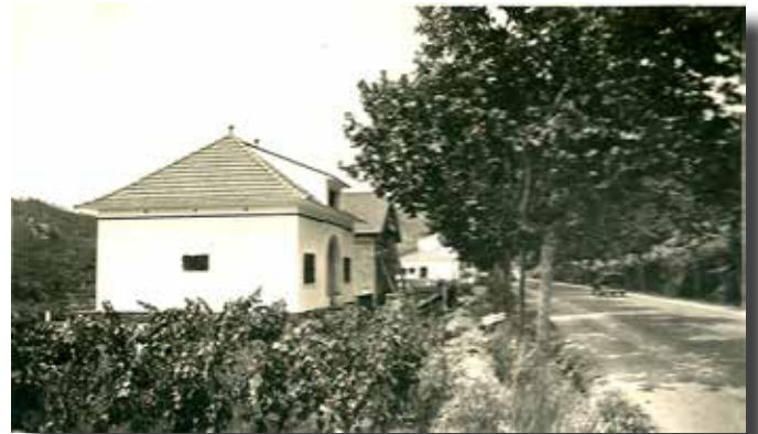
Casa amb vinyes a l'entrada del poble, anys 30 o 40 segle XX.

xos pagesos. El raïm que es conreava en aquestes contrades era de més bona qualitat que en les superfícies planes, perquè quan plovia, la terra no xopava l'aigua, sinó que lliscava cap avall, i el producte resultant, que era el vi, tenia més grau. A Peña Roja el vi podia arribar a fer 13° i a Ca n'Esteve, entre 10,5° i 11°.