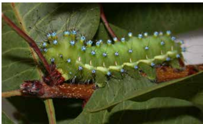
Saturnia pyri (eruga)

Que els insectes estiguin pels carrers de viles i ciutats és una cosa molt habitual. En alguns països exòtics fins i tot se'n poden trobar de cuinats per fer l'aperitiu. El que ja no es tan freqüent és trobar carrers amb noms d'insectes. Quan en trobem, fan referència a algun grup. Així als Països de parla catalana trobem el carrer de les mosques a Barcelona i Girona o el carrer de les papallones a Gandia. La "calle de la mariposa" la podem trobar a Badajoz, Almeria, Pozuelo de Alarcón i Puertollano, però també a Santa Bàrbara (Califòrnia) i a Tucson (Arizona) dels Estats Units d'Amèrica. Fins i tot trobem a Madrid i Salamanca la "calle del grillo". I de ben segur que n'hi ha moltes més.