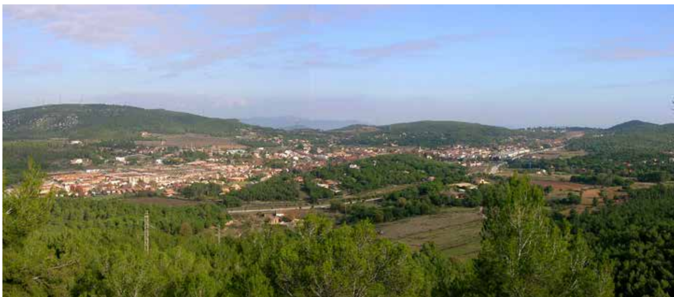
Begues, vista general.

Actualment la població de Begues està connectada per carreteres comarcals amb Gavà, Torrelles de Llobregat i Avinyonet del Penedès per Olesa de Bonesvalls. Hi ha, a més, tot un seguit de camins de muntanya que recorren el parc natural. Per anar a Begues des de Cervelló, els nostres avantpassats utilitzaven el