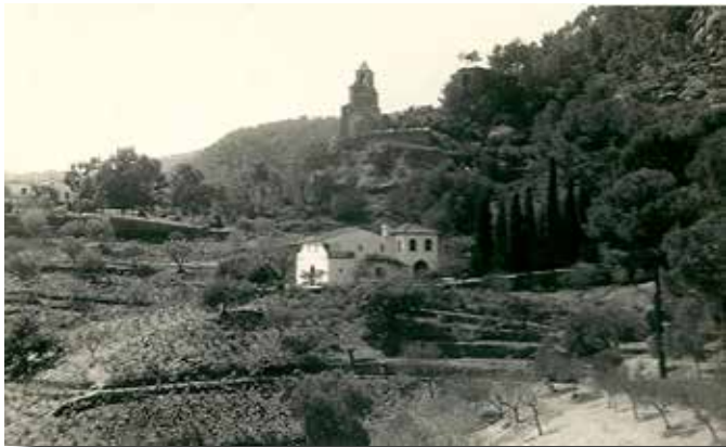
Can Jordi vist des de Can Castany. Any 1955

Penyes del Rector i l'altra, a Penya Roja, i també anava a jornal a altres vinyes com la de cal Ton Espardenyer i la del Federico Vilaginés. Això ho feien molts pagesos, que a més de conrear les seves vinyes es treien un sobresou per poder incrementar els ingressos familiars. A sobre l'església hi havia la vinya del Pepet dels Elàstics.