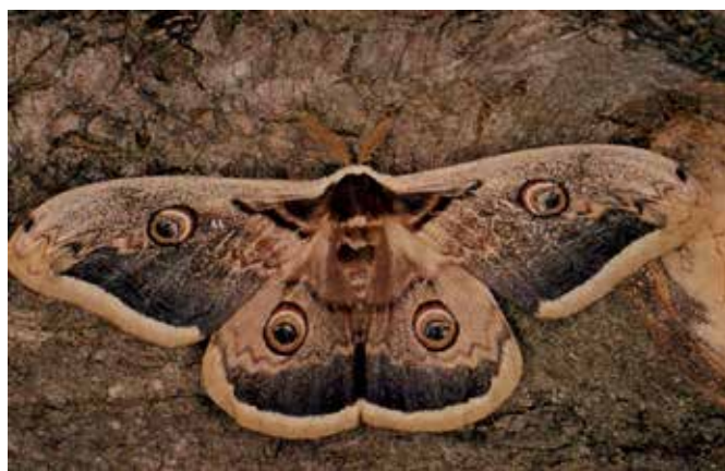
Saturnia pyri (mascle)

taronges coronades amb pels, posteriorment es tornen verdes i amb protuberàncies de color blau. Una eruga completament desenvolupada a punt de crisalidar pot arribar als 10 cm de llargada. Malgrat que les erugues s'alimenten de fulles, entre d'altres d'arbres fruiters, no s'hauria de considerar al gran paó de nit com una plaga, sinó com una riquesa de la diversitat de la nostra fauna.