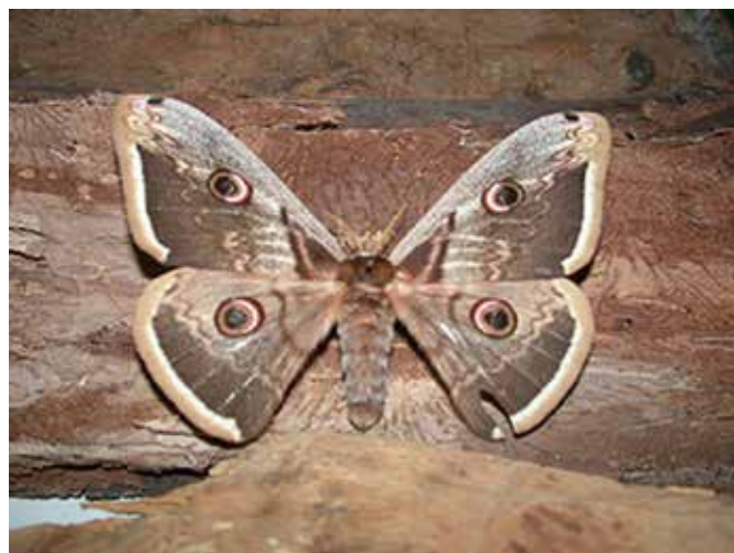
Saturnia pyri (femella)

Les erugues que neixen dels ous s'alimenten de les fulles de diversos arbres com pereres, pomeres, ametllers, cirerers, salzes, pollancre, freixes, roures, castanyers, oms o nogueres. Les erugues són primer fosques i amb protuberàncies