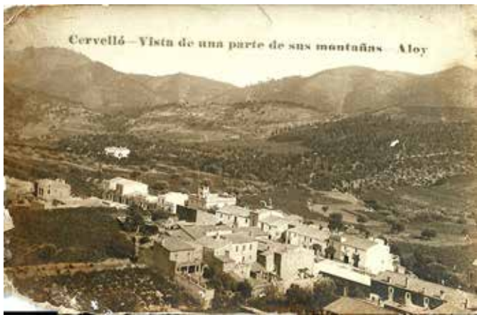
Cervelló, principis segle XX

Per tant, el que ara és polígon industrial situat sobre l'avinguda de Catalunya, abans eren vinyes, i darrere de la casa del Manolo Rovira, on ara hi ha l'escola bressol La Masia, i fins a arribar a la masia de Ca n'Esteve, tot era una gran extensió de mar de vinyes. Dins d'aquesta zona hi havia peces de terra més planeres que altres, situades prop de la masia, com la plana de Ca n'Esteve, que eren molt ben preuades pels pagesos, perquè eren molt fàcils de treballar. I al final del poble fins a la Llibra, el sòl també estava conreat per vinyes, entre elles, la del Cento.